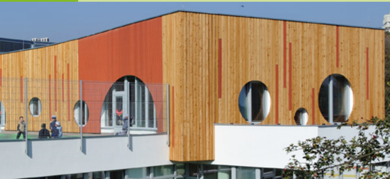
* Minimální UV ochrana

RYCHLEJŠÍ, VYDATNĚJŠÍ A ÚSPORNĚJŠÍ VE SPOTŘEBĚ